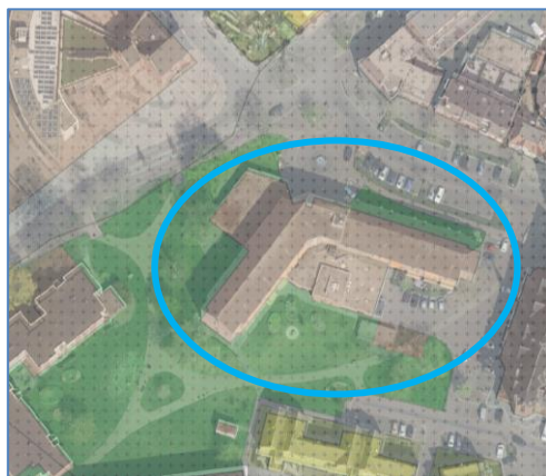
Afb. 1: situering