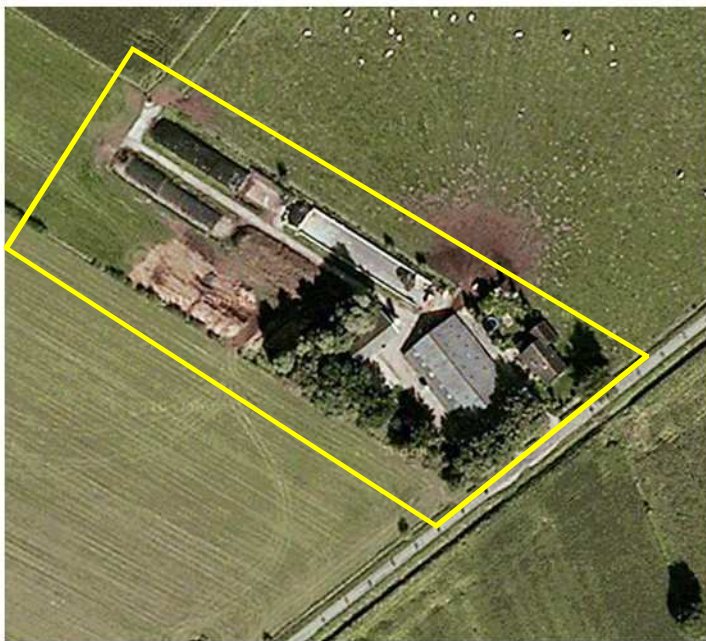
Detailopname van het onderzoeksgebied; deze wordt met de gele lijn aangeduid.

Het onderzoeksgebied bestaat uit een agrarisch erf en agrarische cultuurgrond. Op het erf staan, naast een woning, een loopstal en een houten werktuigenberging. Het erf wordt aan de zuidwest- en zuidzijde omzoomd door een hakhoutsingel met els, berk en eik. Deze singel is recent afgezet door de eigenaar. Open water ontbreekt in het onderzoeksgebied. Op de onderstaande afbeelding wordt het erf in detail weergegeven. De houten werktuigenberging is gedekt met golfplaat en heeft geen dak- en wandisolatie.