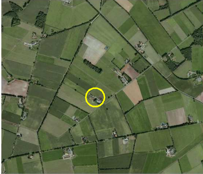
Situering van het onderzoeksgebied. Deze wordt met de gele cirkel aangeduid.

Het onderzoeksgebied is gesitueerd aan de Schurinkweg 12 in Harreveld. Het ligt in het buitengebied. Op onderstaande luchtfoto wordt de globale ligging van het onderzoeksgebied weergegeven